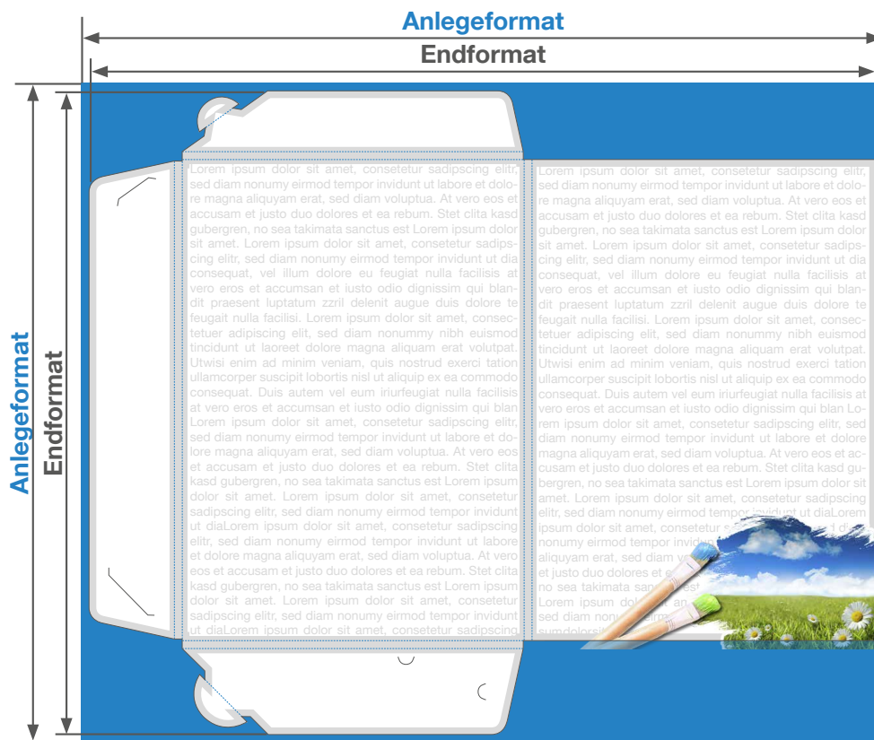
Zeichnung nicht maßstabgetreu

Anlege- und Endformat: Je nach Füllhöhe. Siehe Vorlagen.