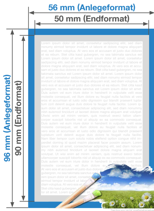
Anlegeformat: 56 mm x 96 mm Endformat: 50 mm x 90 mm